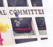
▲最長命水火箭曾試過停留30秒才下降。