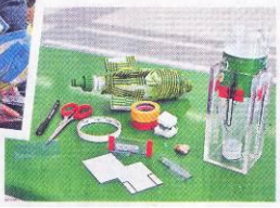
▶水火箭的工具簡單，包括膠片、膠紙和石仔。