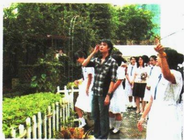
●同學帶天航參觀學校科學園。