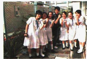
●大家在燦爛陽光下合照！