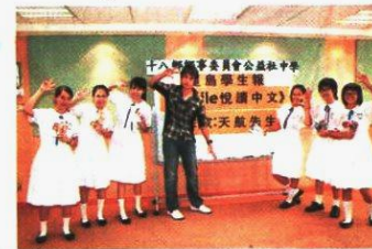
●天航提議大家擺出時下少女最愛的「數字手勢萌士」！