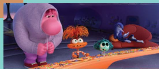
《玩轉腦朋友2》電影圖片

倘若家長和小朋友們都抱著家醜不外揚或逃避的心態，只會耽誤治療的時間，加重病情的嚴重性，甚至到了自殺不遂才知道自己患上情緒病。如果發現子女有情緒困擾，應好好陪伴，協助他們接納自己情緒，積極考慮尋求老師或社工的幫助。在成長路上，每個人難免遇上高低起伏，最重要的是允許自己體驗各種情緒和具備控制這些情緒的能力。