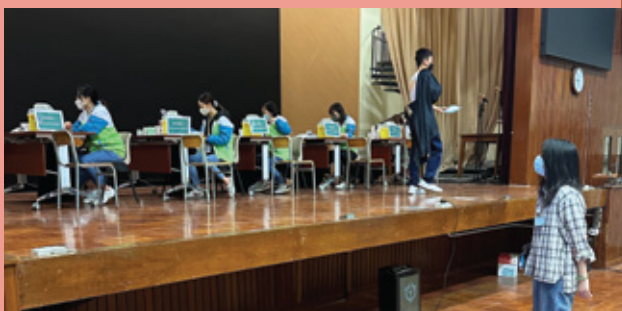
觀察學生注射疫苗