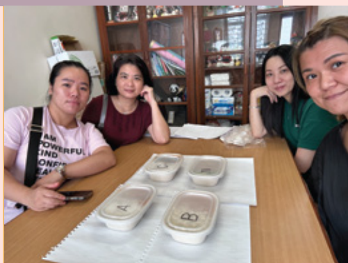
試食學生午餐飯盒