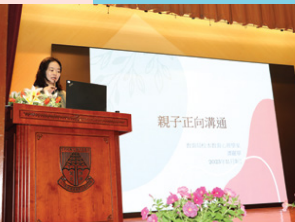
「親子正向溝通」家長專題講座