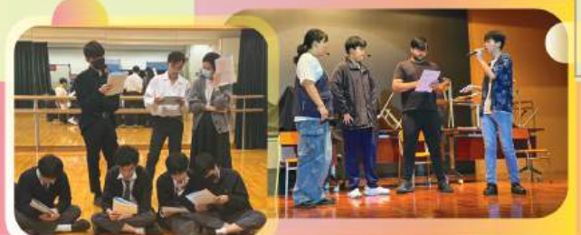
Members trained by English teachers in groups

Students who demonstrate strong abilities in writing and speaking create and perform their own radio plays with guidance from English teachers.