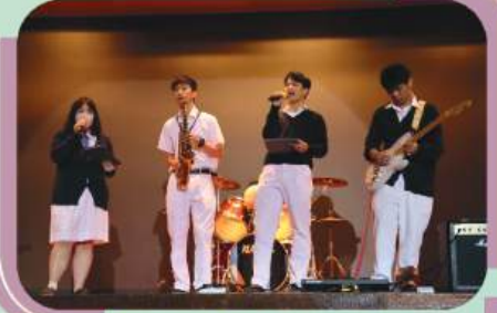
English band show