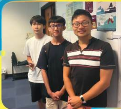
數學英才精進課程