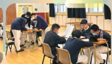
Radio drama lessons