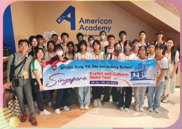
Visiting XCL World Academy in Singapore

Twenty-two exceptional students in English from four forms earned the chance to join the Singapore English and Cultural Study Tour, allowing them to explore local landmarks, galleries, and museums. They also attended an English lesson at XCL World Academy to give them a glimpse of international students' school life. Throughout the trip, our students engaged with locals, enriching their understanding of Singapore's unique history and diverse cultures.