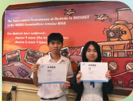
香港青年協會領袖學院青年—— 外交暑期學校課程