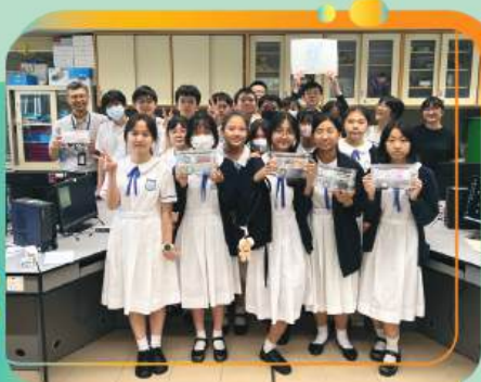
參與師生展示他們的科藝作品

由香港賽馬會慈善信託基金捐助、香港城市大學主辦。透過工作坊，讓本校教師及學生掌握如何應用數碼科技進行藝術創作，為傳統創作方式注入新元素，學生透過聾啞藝術家的分享和體驗活動提昇對共融藝術的認識，啟發學生反思如何讓殘疾人士欣賞藝術及參與藝術活動，一方面培養學生的正向價值觀，同時亦能透過藝術科技建立共融的社會。