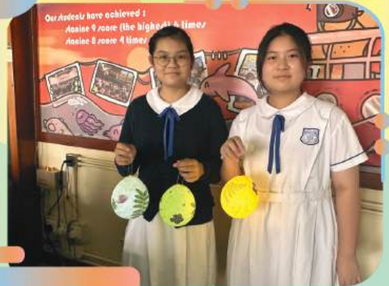
學生利用校園內的植物及環保材料製作中秋花燈。