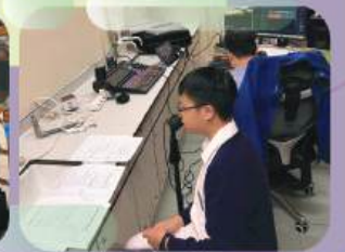
Inter-school radio drama competition