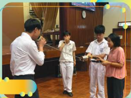
香港城市大學導師向本校學生講解殘疾人士欣賞藝術的方式