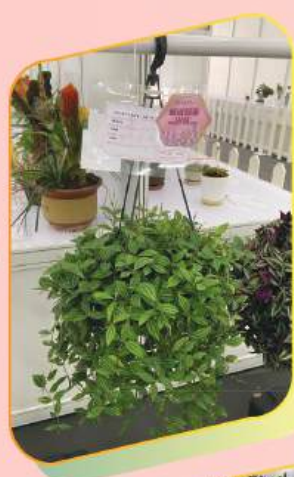
2024年香港花卉 展覽植物展品比賽 全港公開組冠軍 (其他吊籃式賞葉植物)