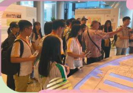
Exploring local museums