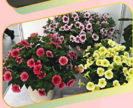
2024年香港花卉 展覽植物展品比賽 新界區中學組冠軍 (賞花類植物)