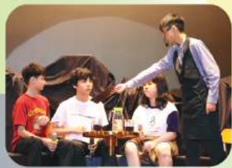
Drama Club performance