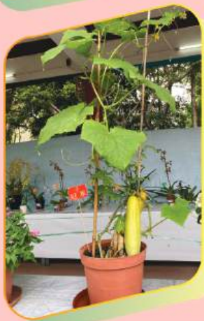
屯門盆景蘭花暨 道德經毛筆書法展覽2024 盆栽花卉參展比賽 冠軍 (中學組時花綠葉蔬果組)