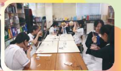
Makeup workshop for drama