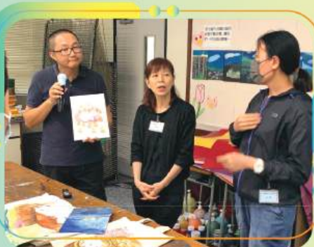
聾啞藝術家以手語向學生展示及解說作品