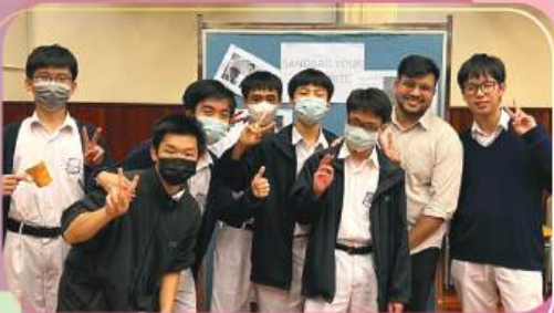
World Shapers game booths

Last year, they ran game booths for two days with the theme 'World Shapers' and hosted an English band show featuring some of our most talented students. To encourage reading and foster creativity, they also arranged a Book Costumed Character Day where students dressed as their favorite fictional characters.