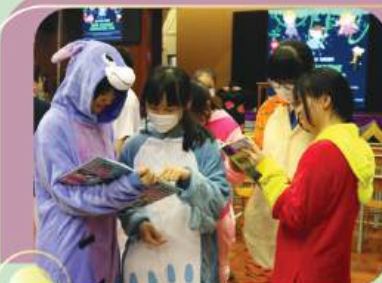
Book Costumed Character Day at the English Book Fair