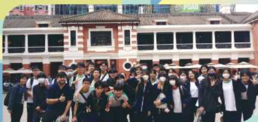
F.3 excursion to Tai Kwun