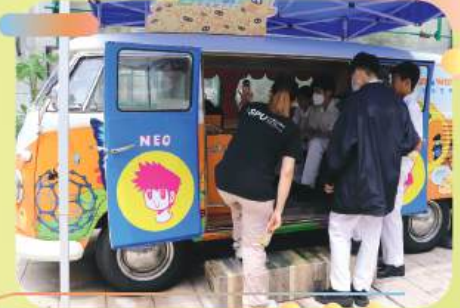
科學館納米號訪校活動