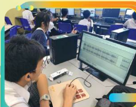
參與學生製作藝術作品的聲音部份