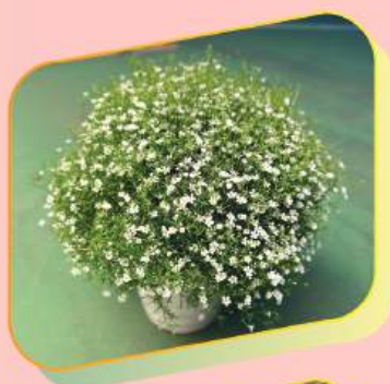
香港北區花鳥蟲魚展覽 2023冠軍 (其他一年生植物小品盆花)