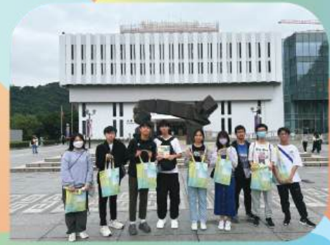
學生到香港中文大學 參加本科入學資訊日。