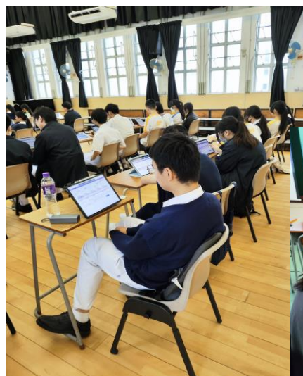
桌上/網上 投資遊戲