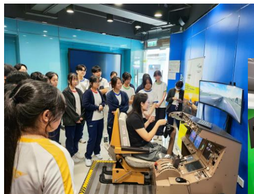
航空公司業務體驗