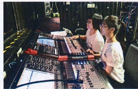
● 後台控制工作十分複雜。